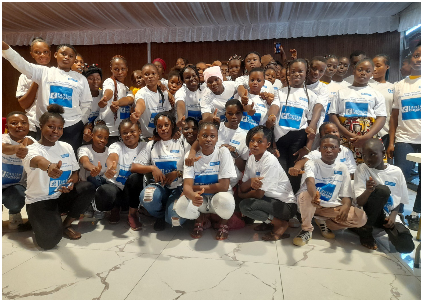
Les bénéficiaires du projet "TANTIE BAGAGE ABOBO"