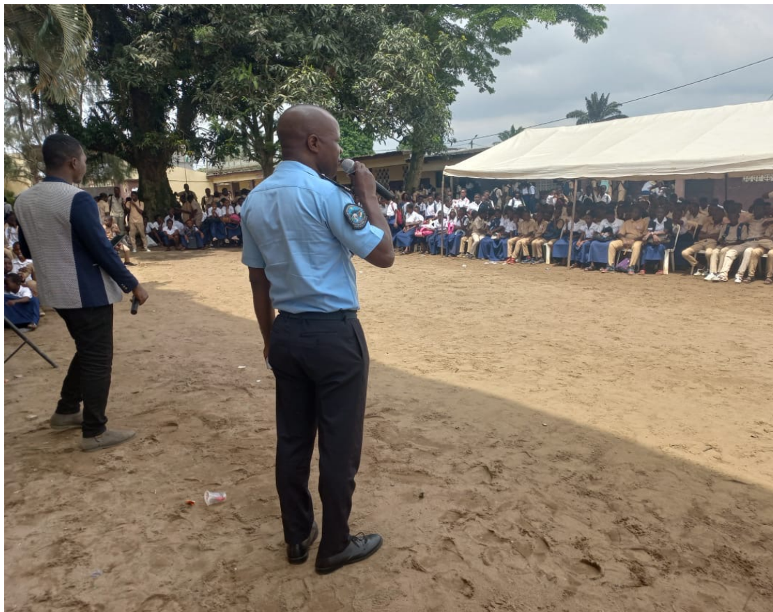
Sensibilisation des élèves sur les dangers de la consommation d'une forme de drogue communément appelé « KADAFI »